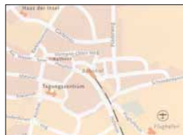
Lageplan der Tagungsstätten

Per Lufttaxi-Dienst von Harlesiel und Norden/Norddeich in knapp 10 min., von Emden in ca. 20 min., von Bremen in ca. 35 min. nach Langeoog. Nähere Auskünfte über Flugplatz Langeoog, Telefon (04972) 693-295, oder in Reisebüros. Der Flugplatz Langeoog ist geöffnet vom 01.05.-30.09. (Flüge außerhalb dieser Zeit auf Anfrage/nach Voranmeldung). Witterungsbedingte Änderungen vorbehalten.